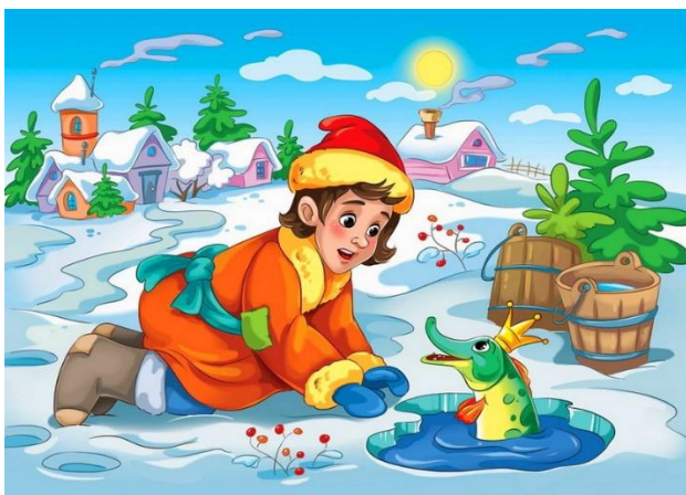
«По щучьему веленью»

https://cloud.mail.ru/public/1FRW/9mXc3kVAd