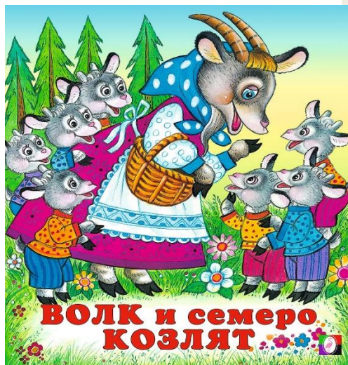
«Волк и семеро козлят»

https://cloud.mail.ru/public/WHGL/x1xeFR3EK