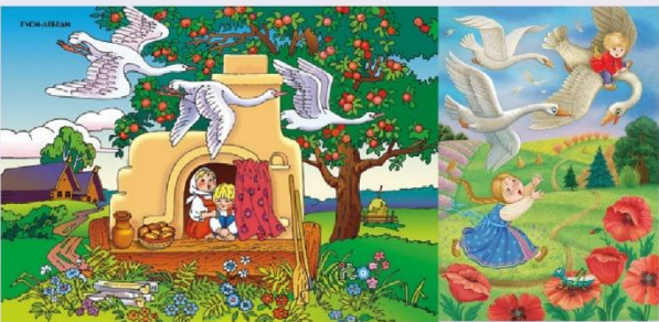
«Гуси – лебеди»

https://cloud.mail.ru/public/1FRW/9mXc3kVAd